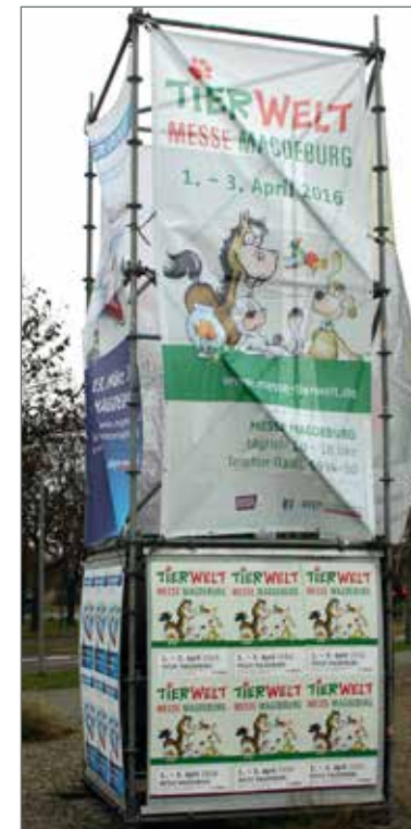
(2) Jerichower Straße