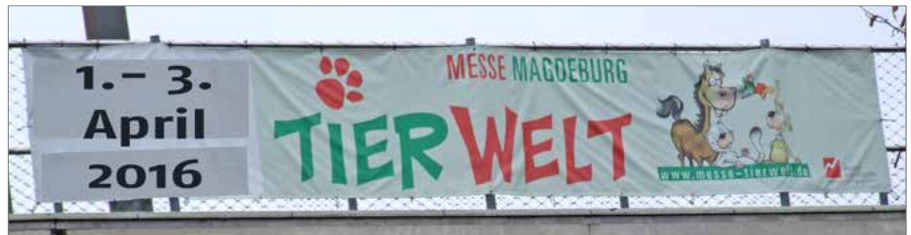
(2) Beispiel an der Brücke über die Herrenkrugstraße

Angebote gültig ab 1/2018 // Preise zzgl. der gesetzlichen MwSt.