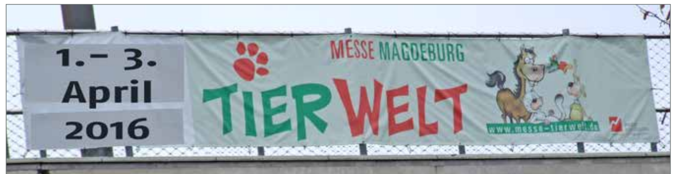
(2) Beispiel an der Brücke über die Herrenkrugstraße

Angebote gültig ab 1/2018 // Preise zzgl. der gesetzlichen MwSt.